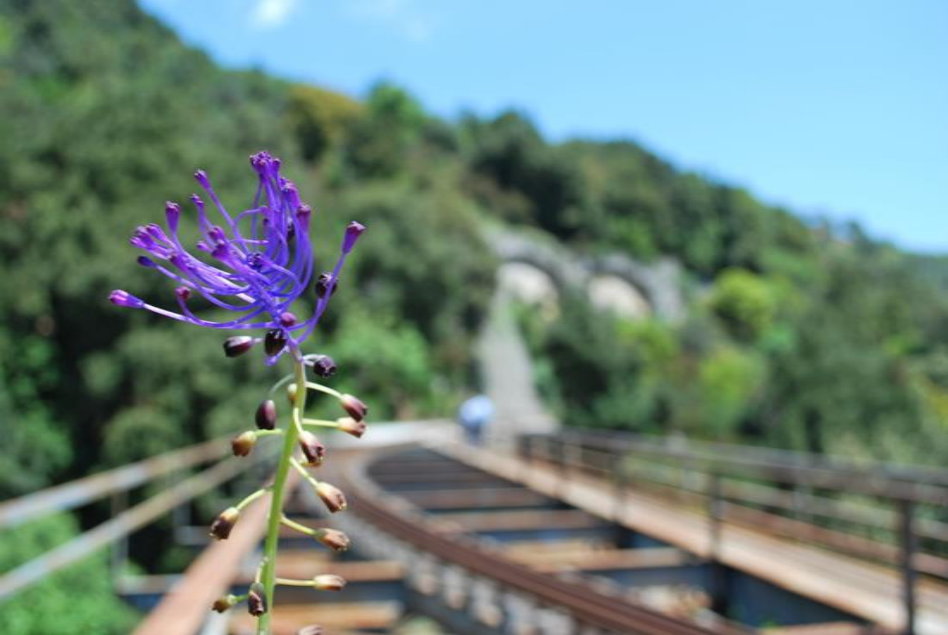
Muscari comosum (Liliaceae)