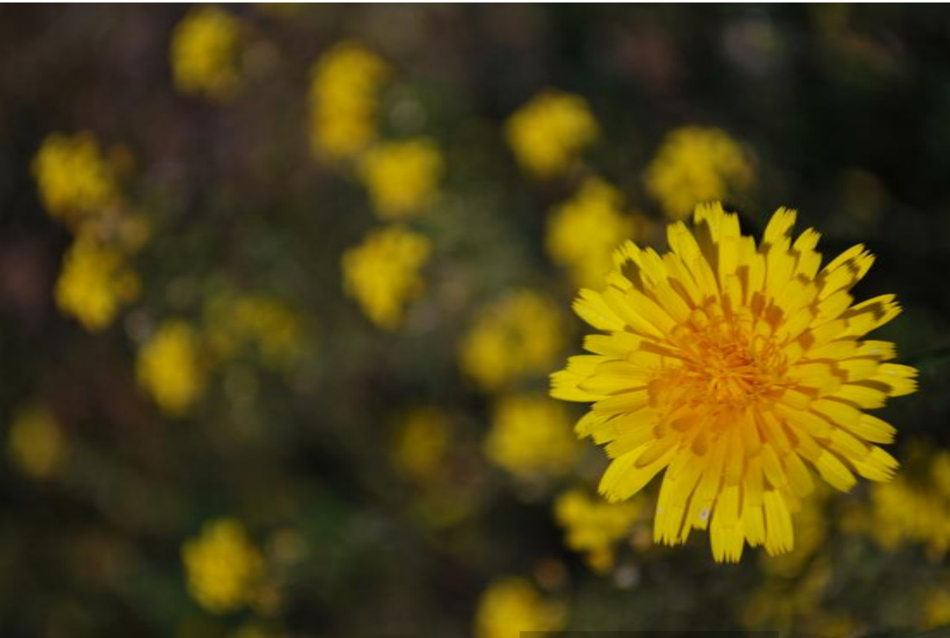
? Crepis sp. (Compositae)