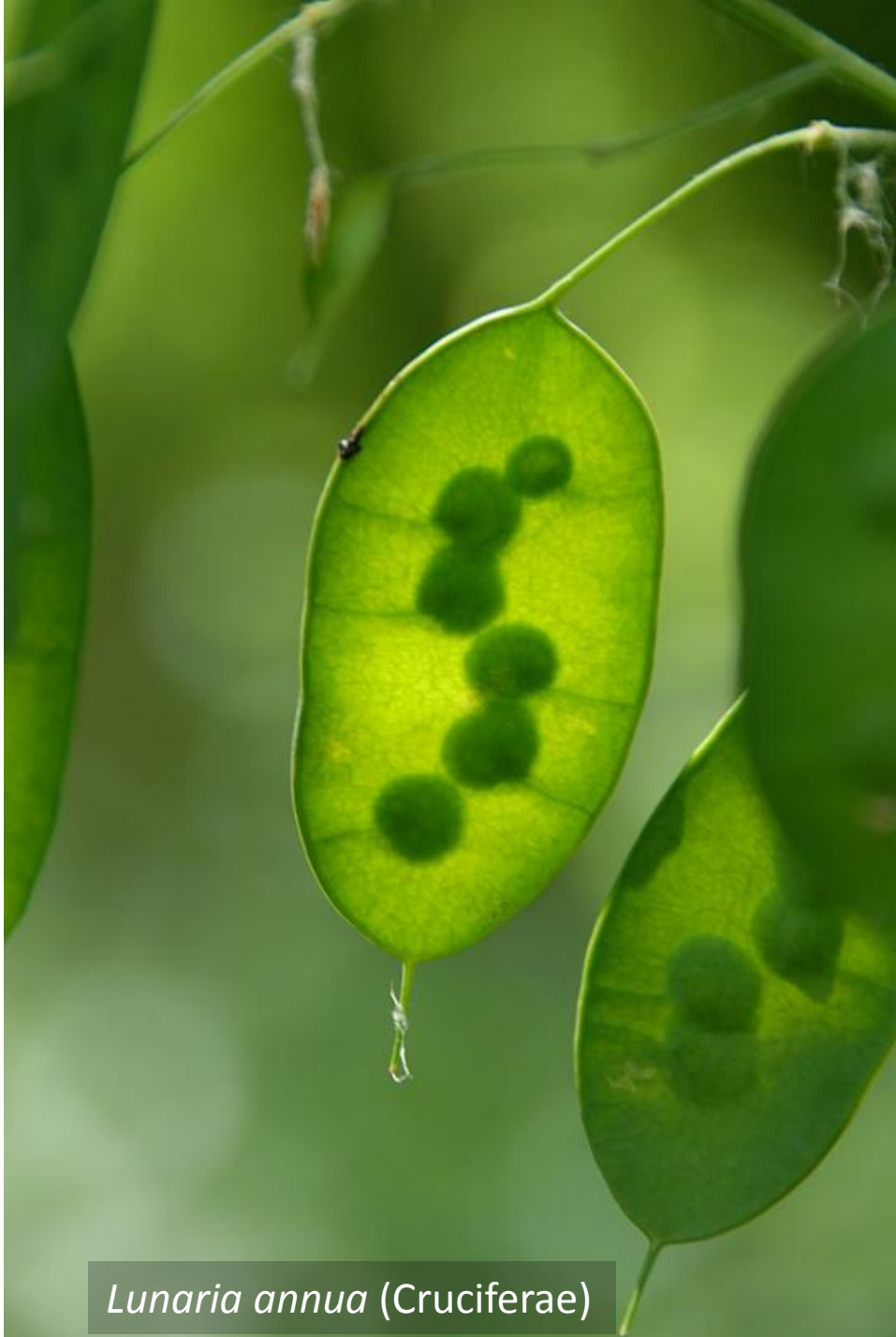
Lunaria annua (Cruciferae)