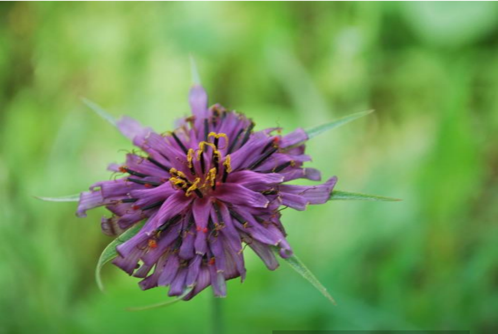
Tragopogon porrifolius (Compositae)