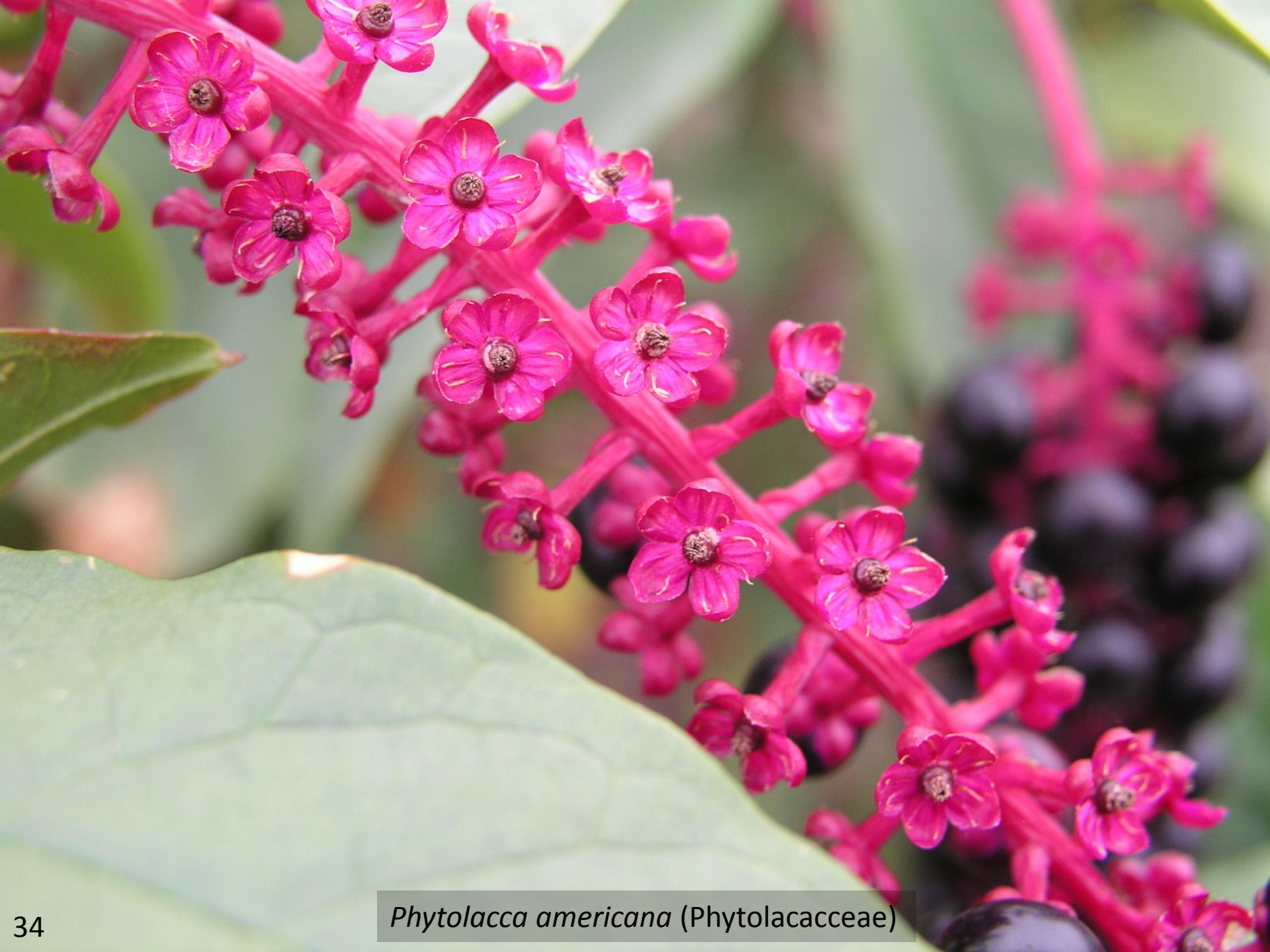
Phytolacca americana (Phytolaccaceae)