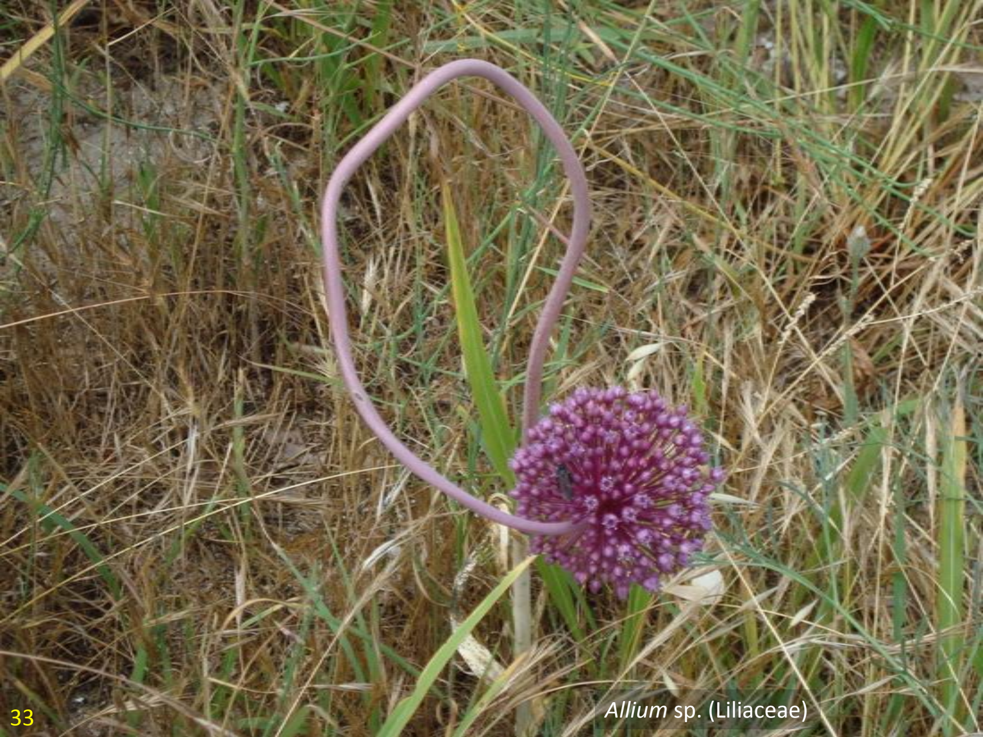
Allium sp. (Liliaceae)