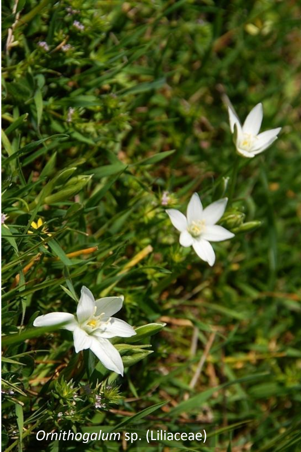
Ornithogalum sp. (Liliaceae)