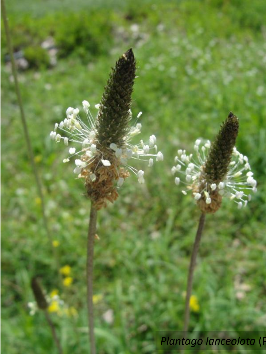
Plantago lanceolata (Plantaginaceae)