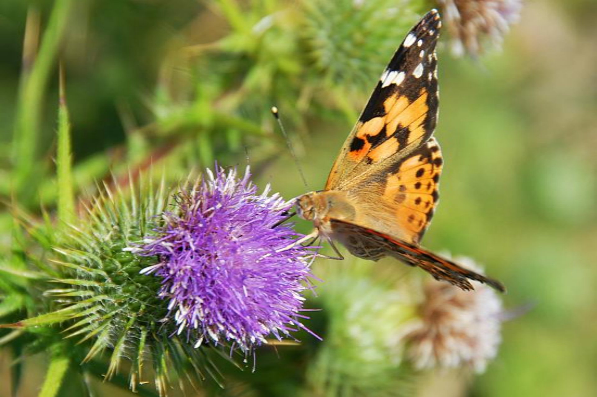
Cirsium sp. (Compositae)