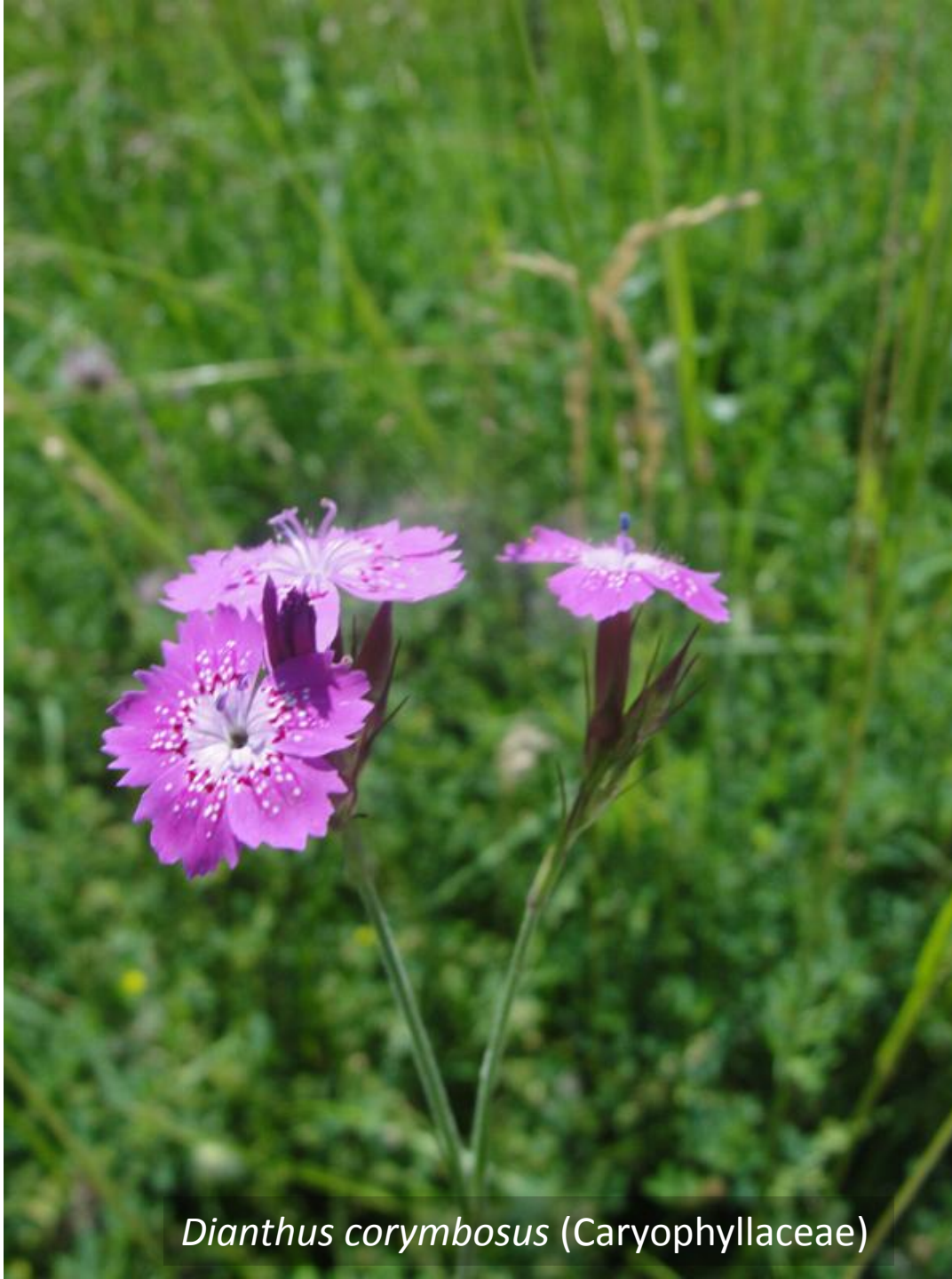
Dianthus corymbosus (Caryophyllaceae)