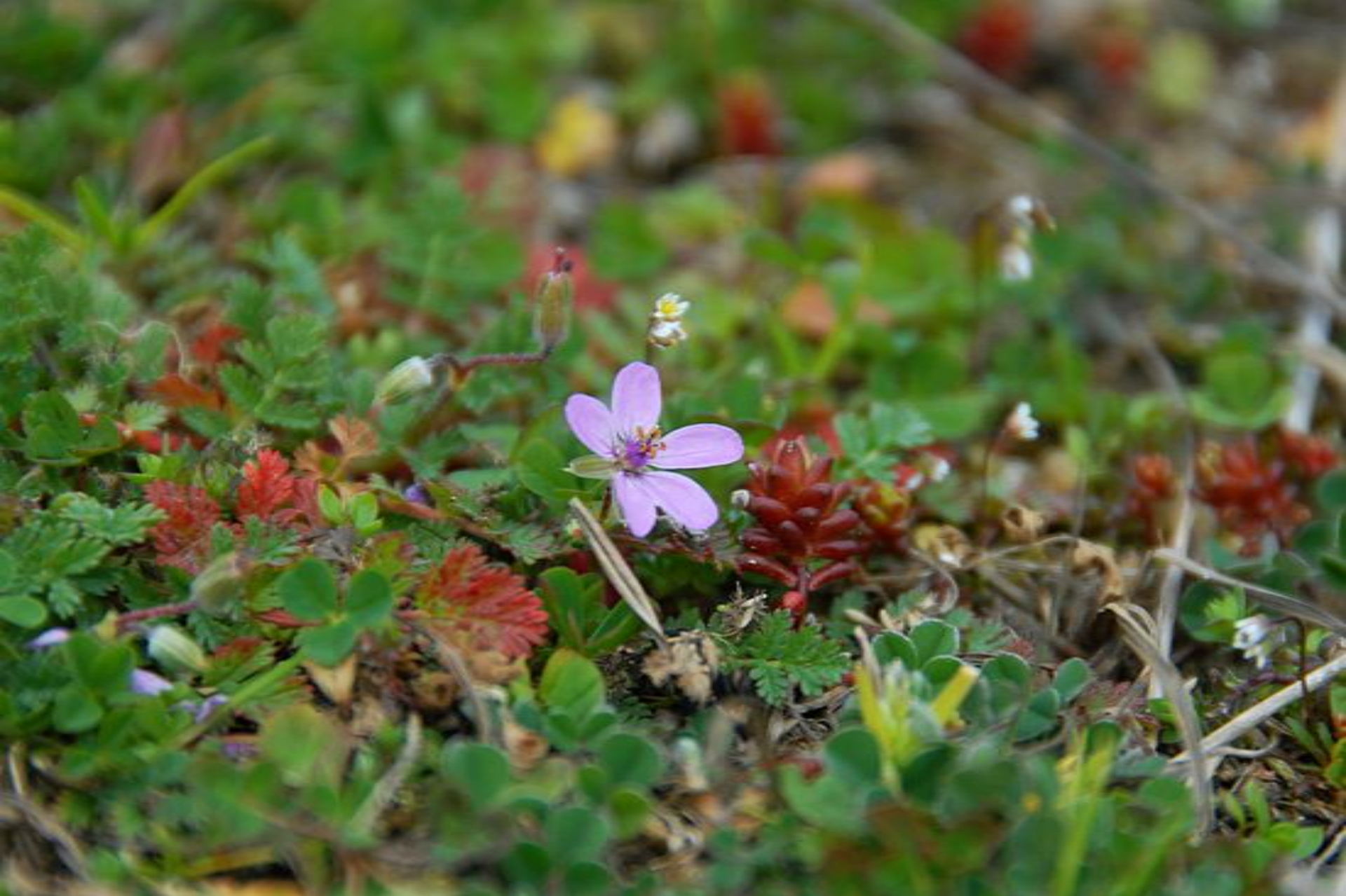
Erodium sp. (Geraniaceae)