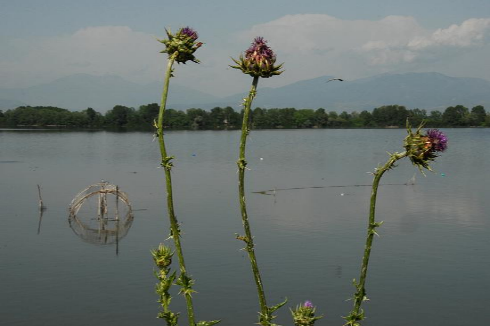
Silybum marianum (Compositae)