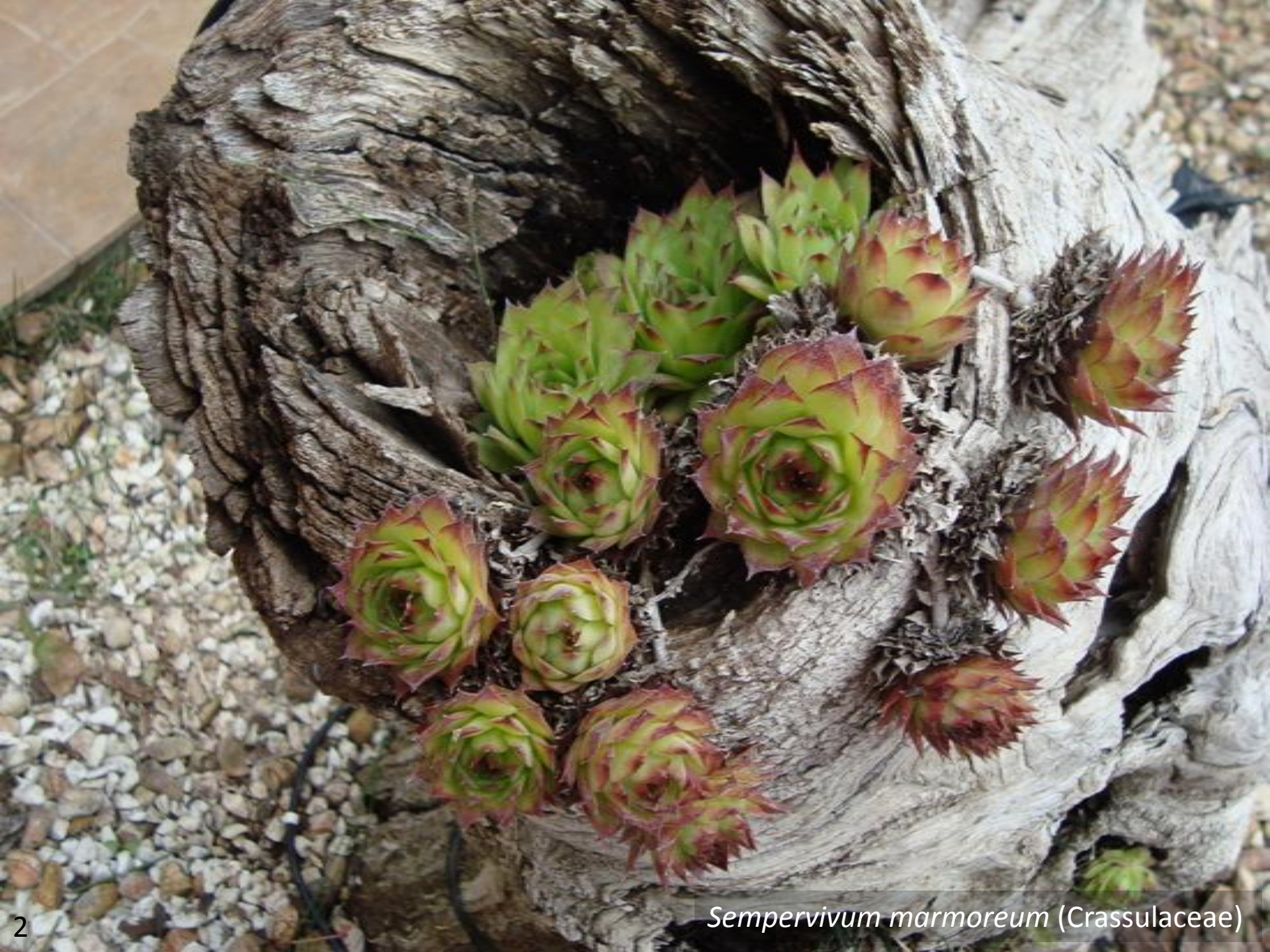
Sempervivum marmoratum (Crassulaceae)