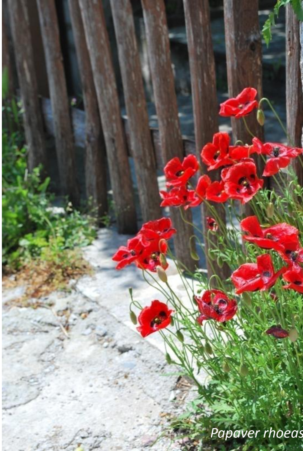
Papaver rhoeas (Papaveraceae)