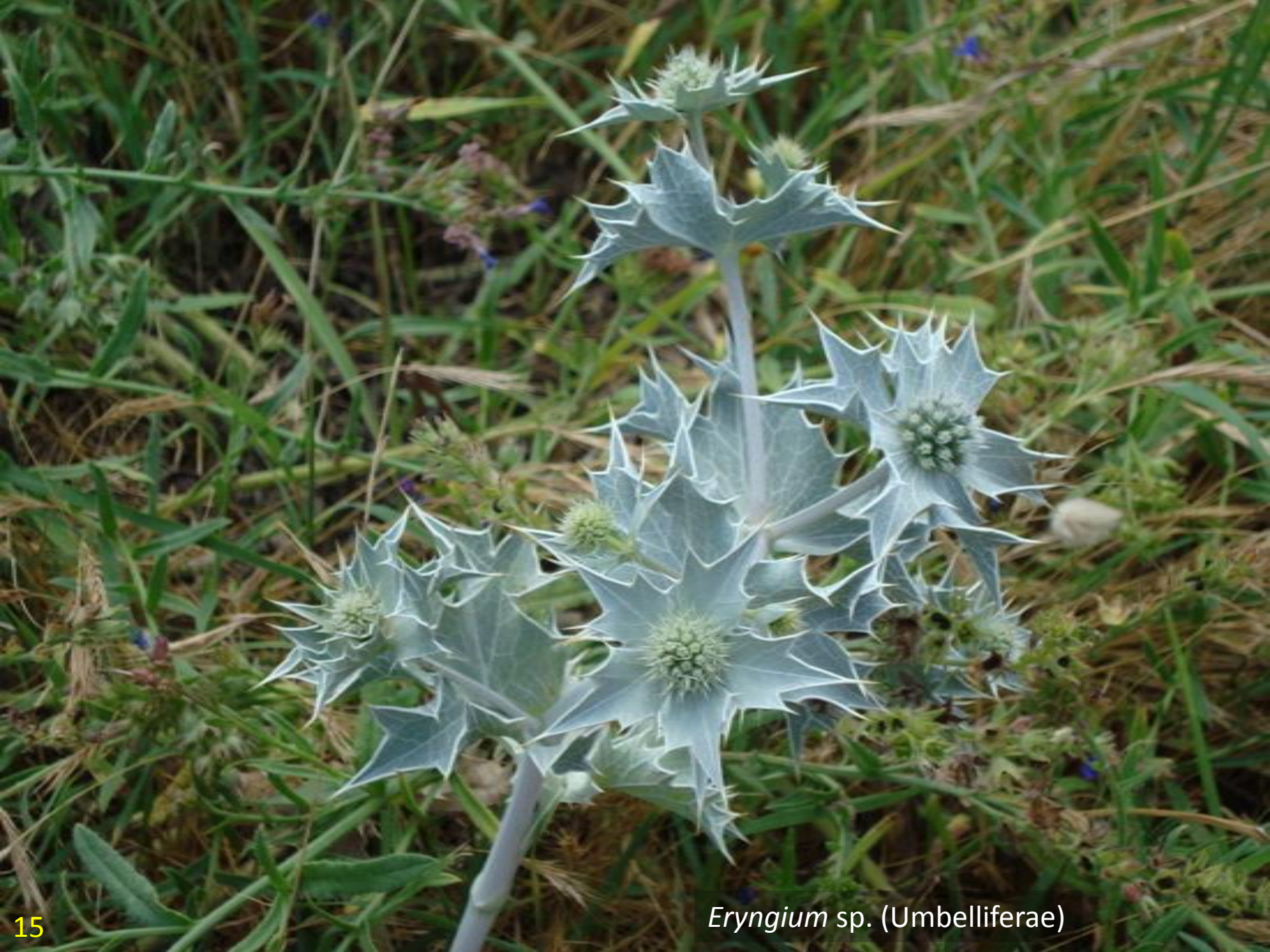
Eryngium sp. (Umbelliferae)