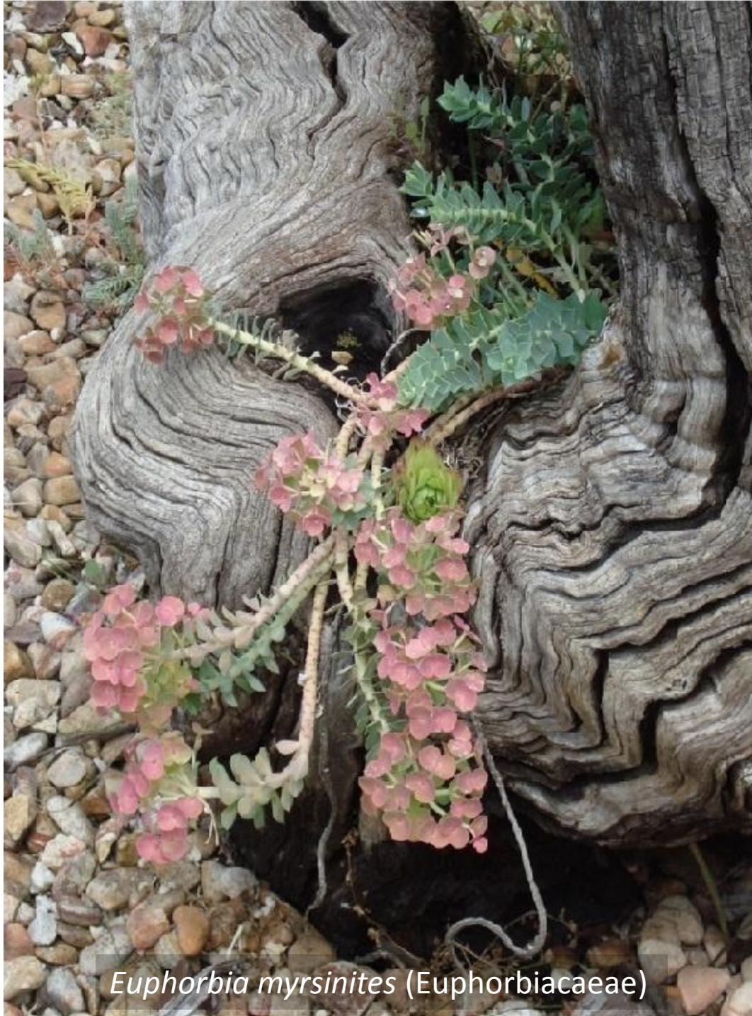
Euphorbia myrsinites (Euphorbiaceae)