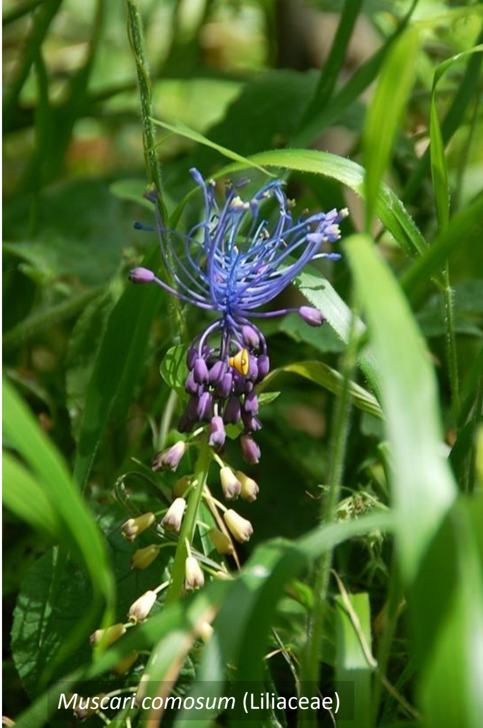
Muscari comosum (Liliaceae)