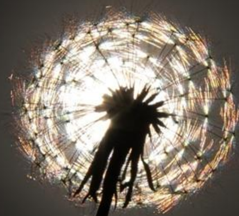
Taraxacum sp. (Compositae)