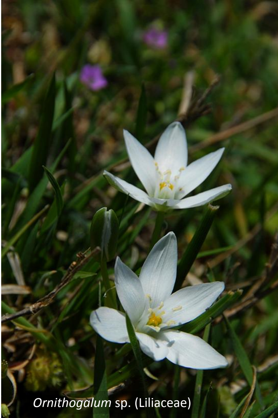
Ornithogalum sp. (Liliaceae)