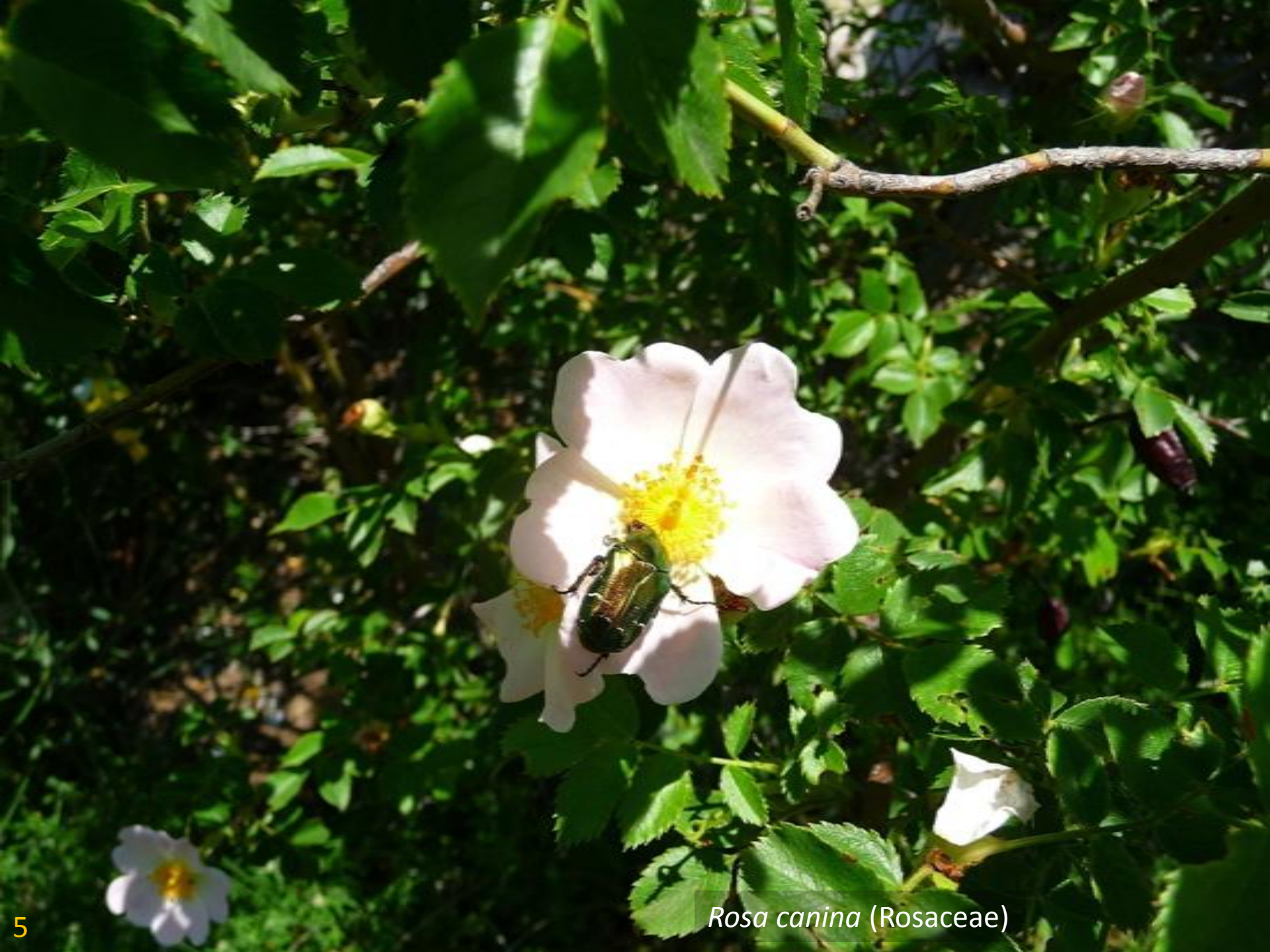
Rosa canina (Rosaceae)