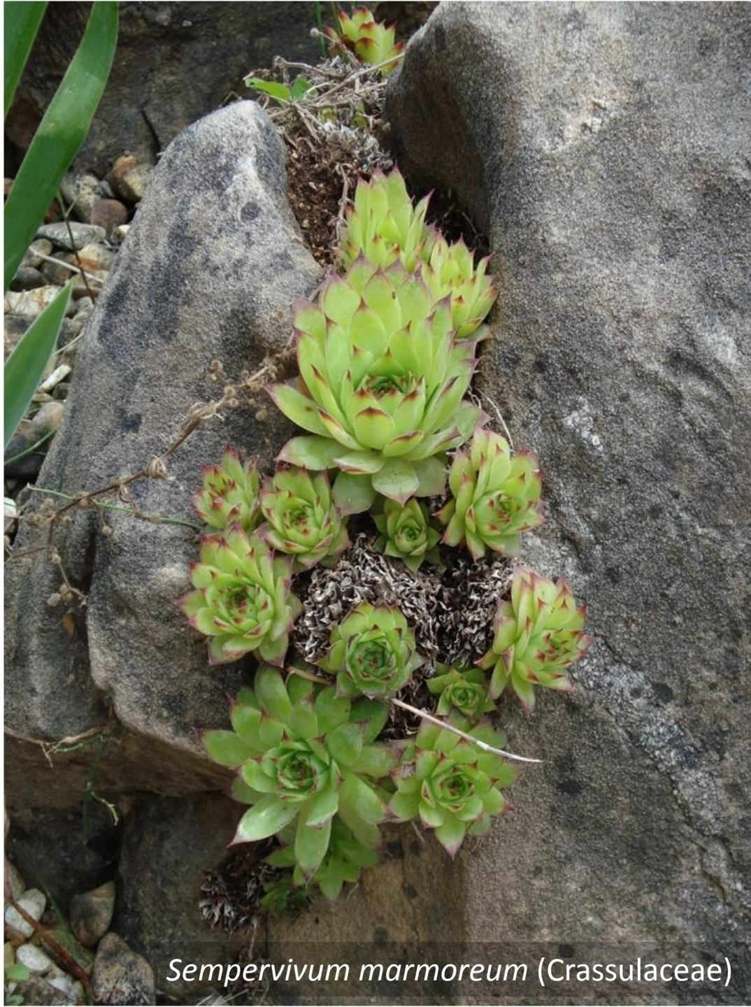
Sempervivum marmoratum (Crassulaceae)