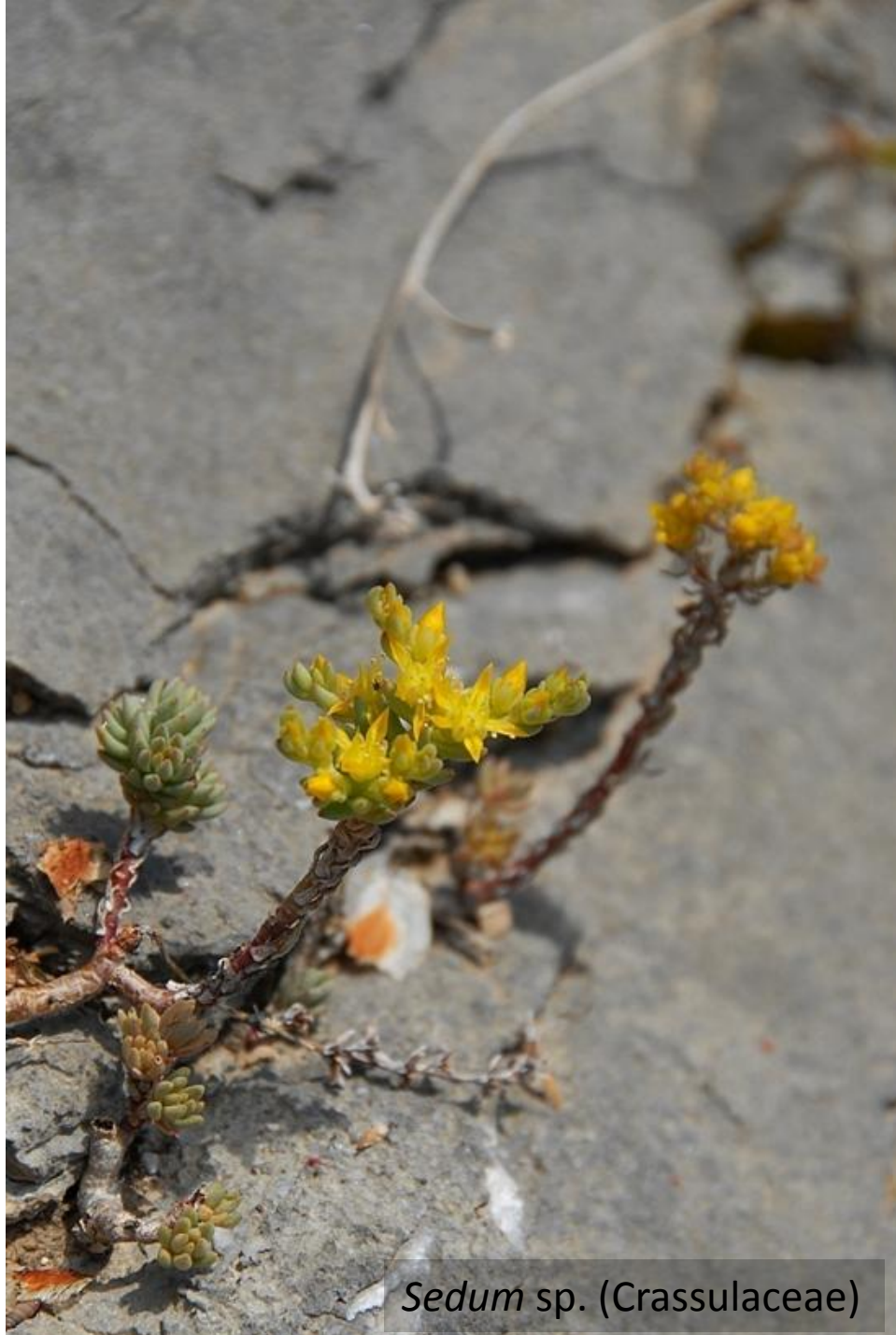
Sedum sp. (Crassulaceae)