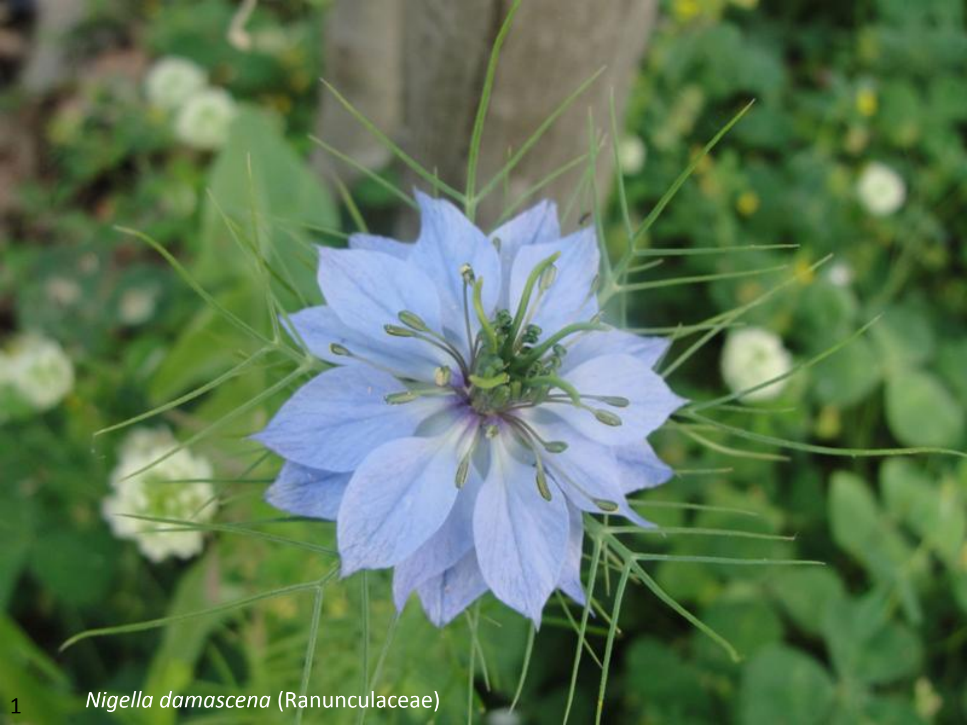
1 Nigella damascena (Ranunculaceae)