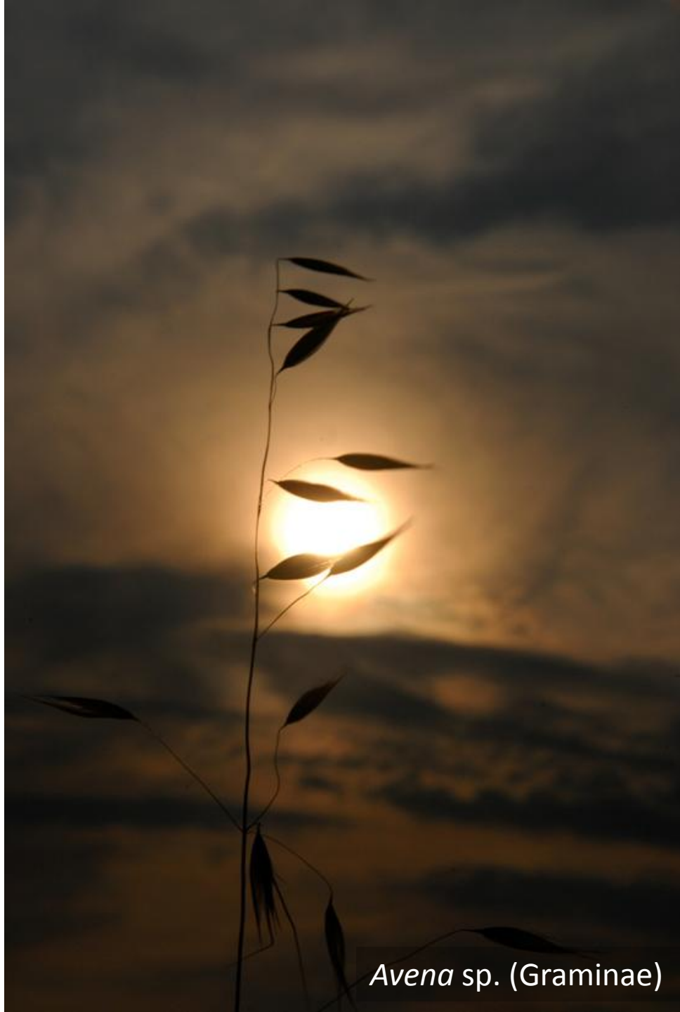
Avena sp. (Graminae)